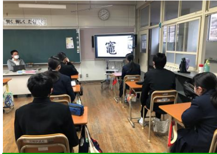
「竈」という漢字に食いつく 1年生