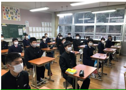
真剣なまなざしで話に集中 3年生

しかし、覚えようとしても忘れていきます。これが忘却曲線で表されたものです。記憶を定着させるためには、できるだけ早く復習する、定期的に繰り返し復習する、これを続けていけば繰り返し時間が短時間で済むようになります。こんな考え方も参考にしながら、残された令和3年度を頑張ってもらいたいと話しました。